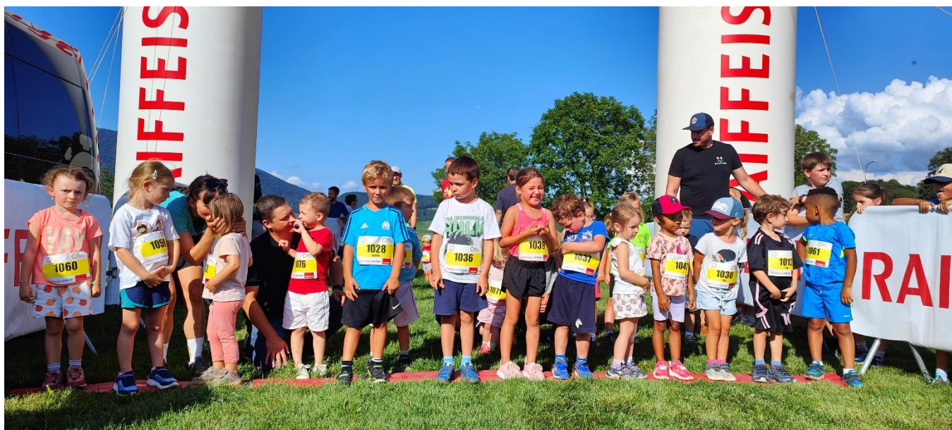
Impatience avant le départ dans la catégorie des plus jeunes